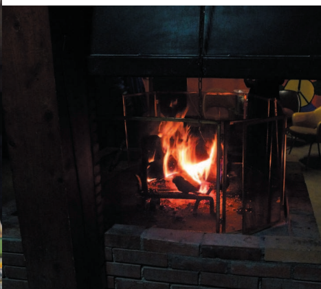
Convivialité avec la cheminée du bar et échanges lors du forum des acteurs et des outils pédagogiques.