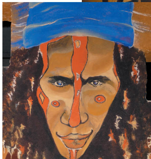
Détails des peintures de la salle de conférence du Martouret.