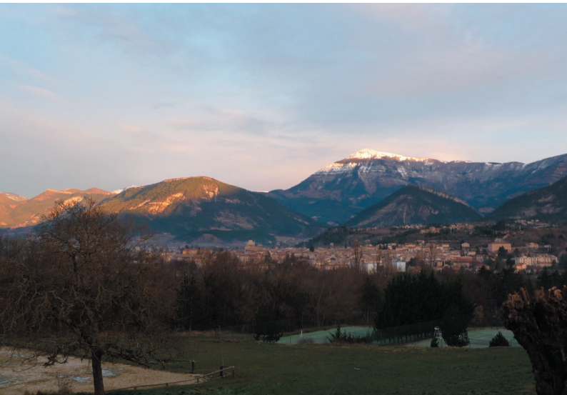
Vue sur Die du Centre du Martouret.

Le Diois compte environ 120 producteurs « bio », ce qui représente un quart de l'ensemble des producteurs bio sur la Drôme. Il détient une grande variété de plantes aromatiques. L'élevage ovin, énormément soutenu durant les années précédentes, est le deuxième pôle dominant.