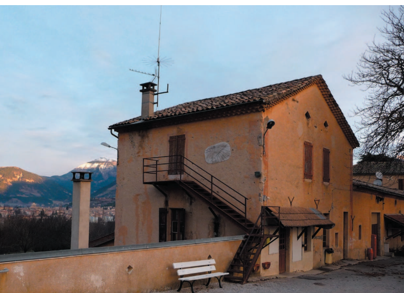
Une partie du Centre du Martouret.

Une vigilance est portée sur les points d'approvisionnement pour la restauration : si ce n'est pas toujours bio, il est fait appel aux producteurs locaux. L'impact économique sur le territoire est d'environ 825 000 € en 2008.