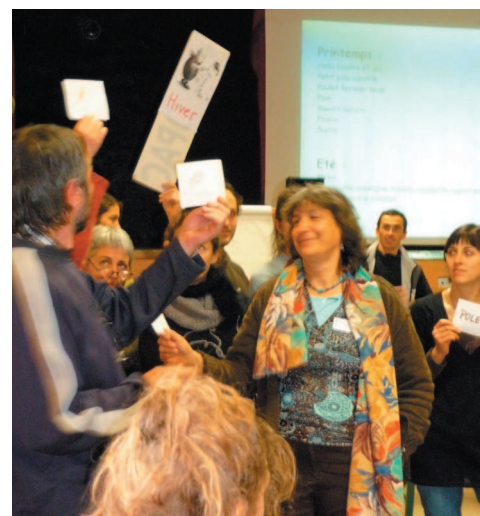
La restitution et participation du «public».

Ce passage est en particulier rendu possible par le soutien qu'apporte le Conseil régional qui rembourse 80 centimes d'euro par repas bio servi pour en diminuer le surcoût lié à l'approvisionnement et à la préparation (au-delà du surcoût de certains produits issus de l'agriculture biologique, les temps de préparation en cuisine peuvent être rallongés) et sur l'introduction régulière de produits issus de l'agriculture biologique il reverse 25% des coûts supplémentaires. Le coût de revient d'un repas est de 3,80€ à 4€ et peut parfois monter jusqu'à 5€. Les familles paient en moyenne 3 € par repas (il existe sept forfaits différents). L'établissement prend donc en charge 1,50 à 2 € par repas.