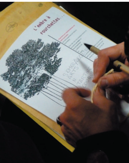
Un participant crée un acrostiche pour l'accrocher sur l'arbre à fourchettes

L'alimentation est un fait culturel conçu comme tel, elle est liée à un temps et un espace précis : les repères sont importants, comme signe d'un patrimoine et d'un territoire (d'une histoire donc) ; tout aussi importante la nécessité du partage, qui semble être aussi primordiale que la qualité du produit. Le manger est un temps de rencontre, d'amour et de plaisir.