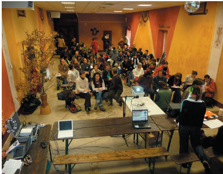
Les participants s'installent avant les conférences...

Alors, aux enfants, les activités de découverte et aux adultes le rôle éducatif. Evidemment, il faudra se remonter les manches et ne pas se décourager ; travailler sur l'analyse de l'image, raisonner les heures passées devant la télévision, imposer des heures pour les repas, refuser l'accès libre